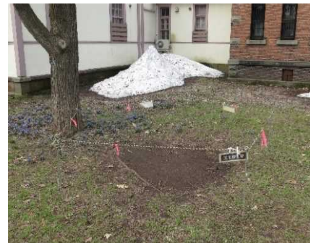
キャッチボールによって芝生がえぐられた場所