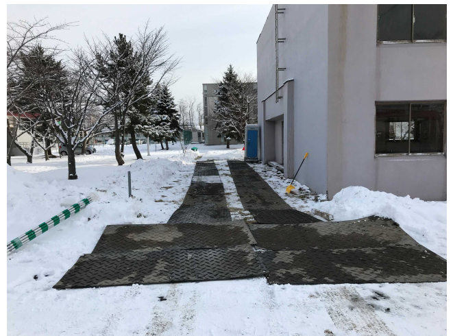
仮設通路、仮設トイレ設置完了