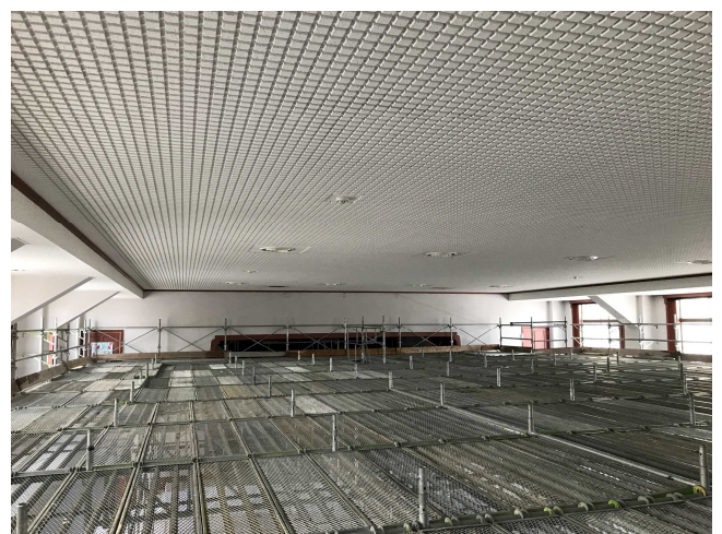
内部足場組立完了（2階）