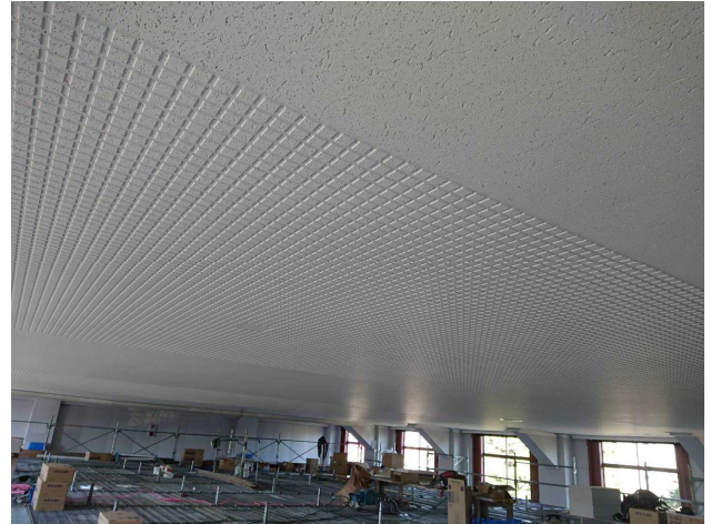
天井仕上げ材張付け完了