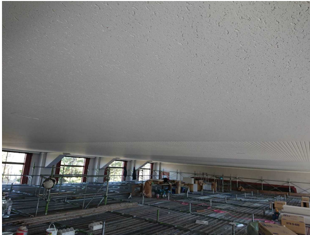
天井仕上げ材張付け完了