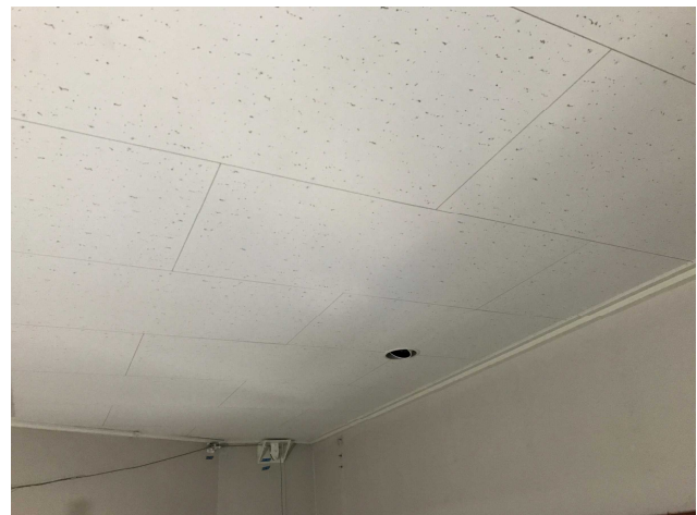
天井仕上げ材張付け完了